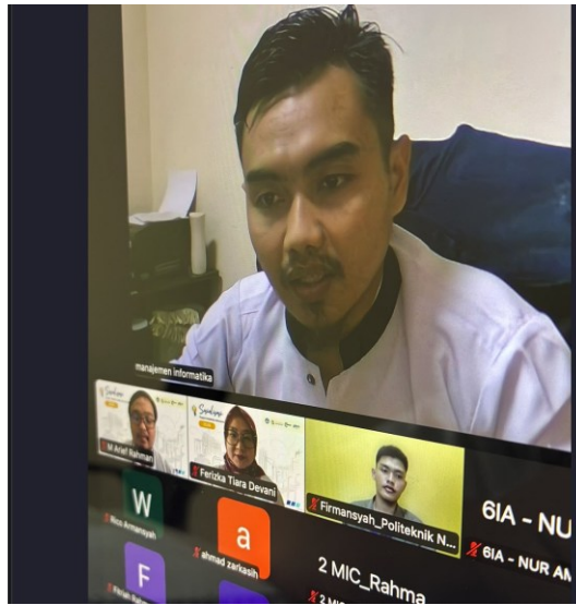
Gambar 2. Pembukaan pelaksanaan Workshop Program Kreativitas Mahasiswa (PKM) Manajemen Informatika Polsri 2026 secara daring melalui Zoom Meeting.