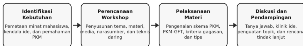
Gambar 1. Diagram tahapan pelaksanaan Workshop PKM Manajemen Informatika Polsri 2026.