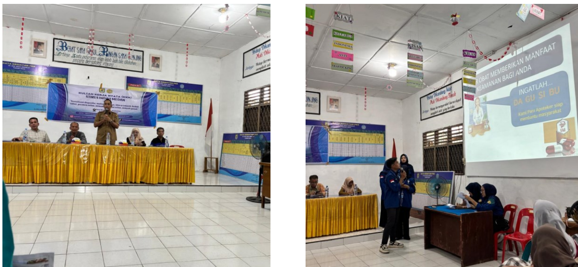
Gambar 3. Bimbingan dan Edukasi Dagusibu Dalam Meningkatkan Kesadaran Pengguna Obat

Setelah mengikuti bimbingan dan praktik, masyarakat memperoleh pengetahuan tentang konsep DAGUSIBU (Dapatkan, Gunakan, Simpan, dan Buang obat dengan benar) serta cara penerapannya dalam kehidupan sehari-hari. Peserta diharapkan dapat menerapkan pengelolaan obat yang benar secara mandiri di rumah untuk meningkatkan keamanan penggunaan obat dan kesehatan keluarga.