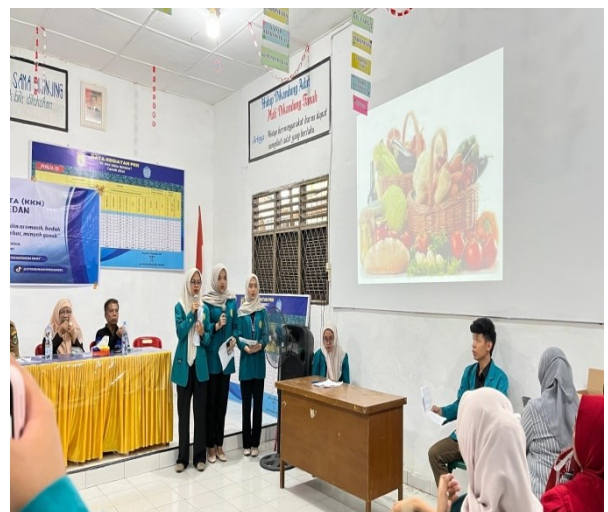
Gambar 3. Penyuluhan Pentingnya Makanan Sehat Untuk Mewujudkan Keluarga Sehat.