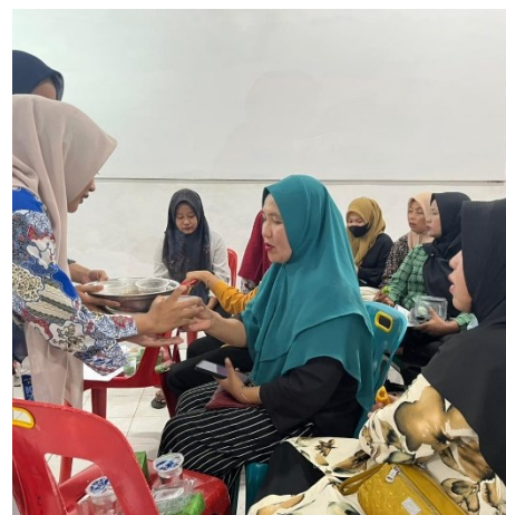
Gambar 3. Bimbingan dan Pelatihan Pembuatan Bedak Tabur Biang Keringat