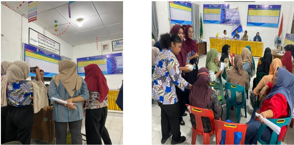
Gambar 3. Bimbingan dan Pelatihan Pembuatan Bedak Tabur Biang Keringat.