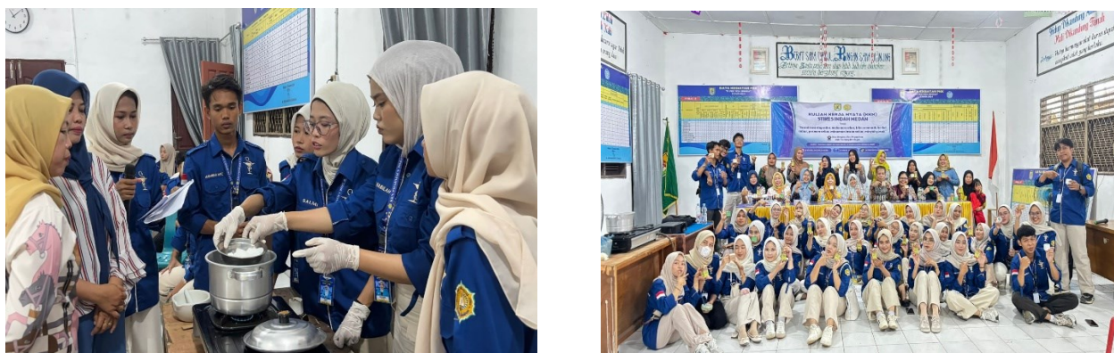
Gambar 3. Bimbingan dan Pelatihan Pembuatan Lilin Aromaterapi

Setelah mengikuti kegiatan penyuluhan dan praktik langsung, ibu-ibu PKK telah mampu membuat lilin aromaterapi secara mandiri dengan hasil yang cukup baik dan layak digunakan maupun dipasarkan. Selain itu, peserta juga dibekali dengan pengetahuan dasar terkait pengemasan yang menarik serta strategi pemasaran sederhana. Melalui pendekatan sosial yang dilakukan selama kegiatan, masyarakat menunjukkan ketertarikan untuk mengembangkan produk lilin aromaterapi ini sebagai salah satu peluang usaha rumahan yang dapat membantu meningkatkan pendapatan dan kesejahteraan keluarga.