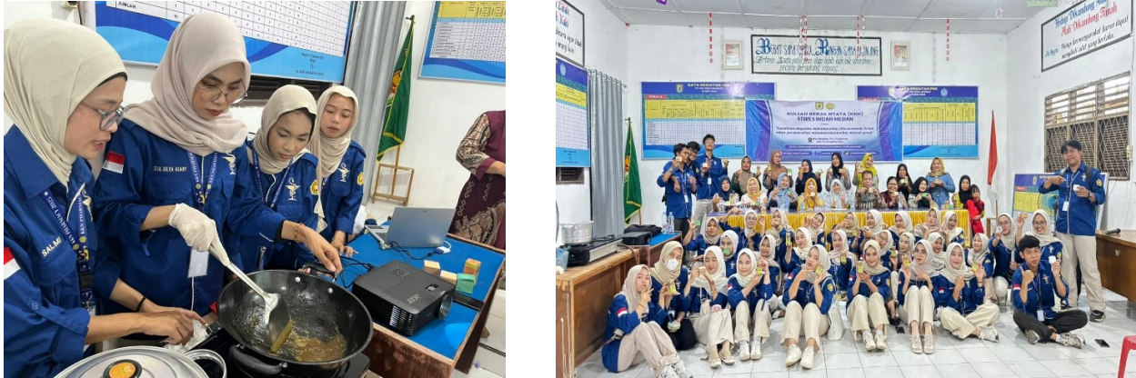
Gambar 3. Bimbingan dan Pelatihan Pembuatan Permen Sari Jahe